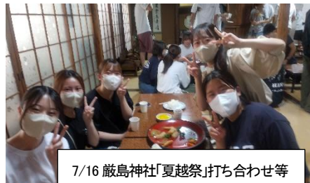
7/16 厳島神社「夏越祭」打ち合わせ等

下関市立彦島児童館(ひこまる)と厳島神社で保育・栄養健康学科の学生によるボランティア活動が行われました。「ひこまる」には70人以上の幼児や保護者の方々が参加されました。厳島神社には市内4大学から45人が参加し、お輿を担いで市内巡回、出店のお手伝い等を行いました。