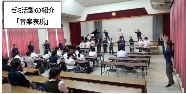
ゼミ活動の紹介 「音楽表現」

栄養健康学科2年生の「給食実務実習Ⅱ」 7月14日(金)自主献立「夏バテ防止 スタミナランチ」生姜焼き、オクラとトマトのナムル最高でした。計9回美味しくいただきました。